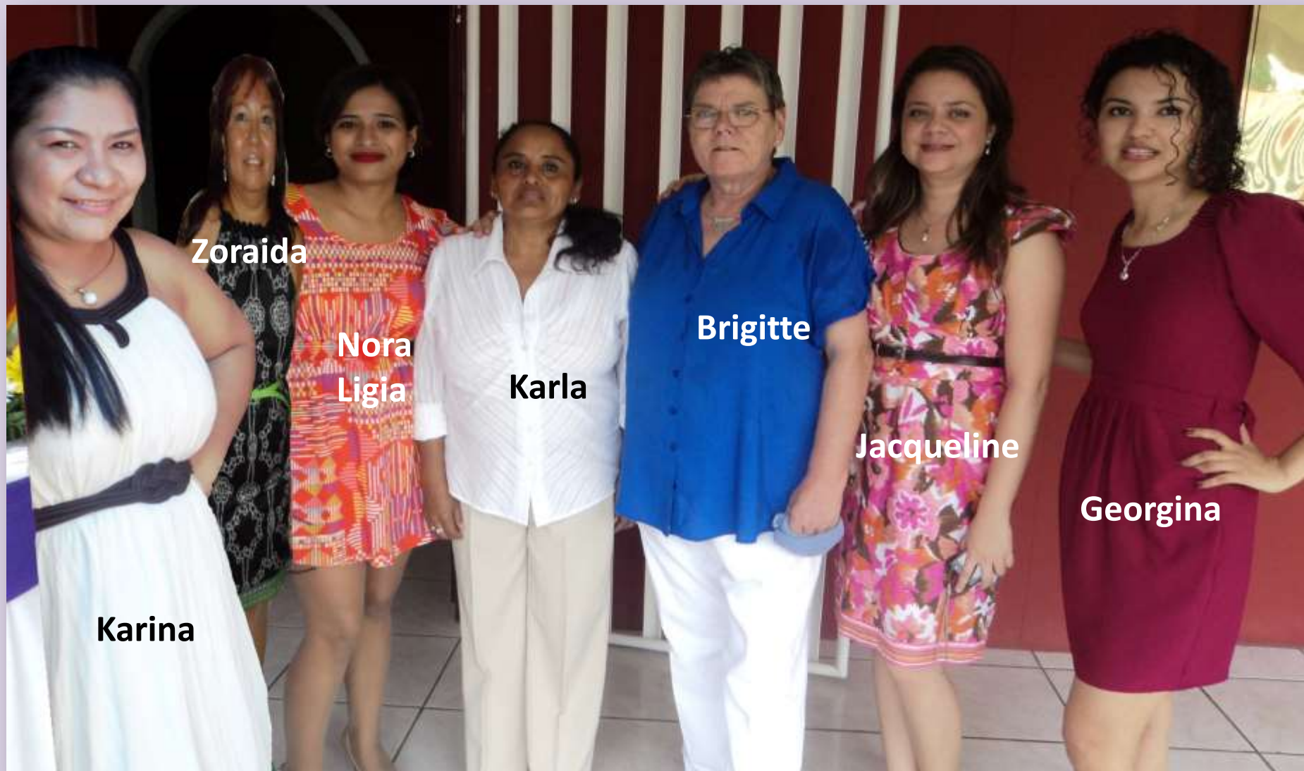
Das Team der Fundación Aguas Bravas Nicaragua....